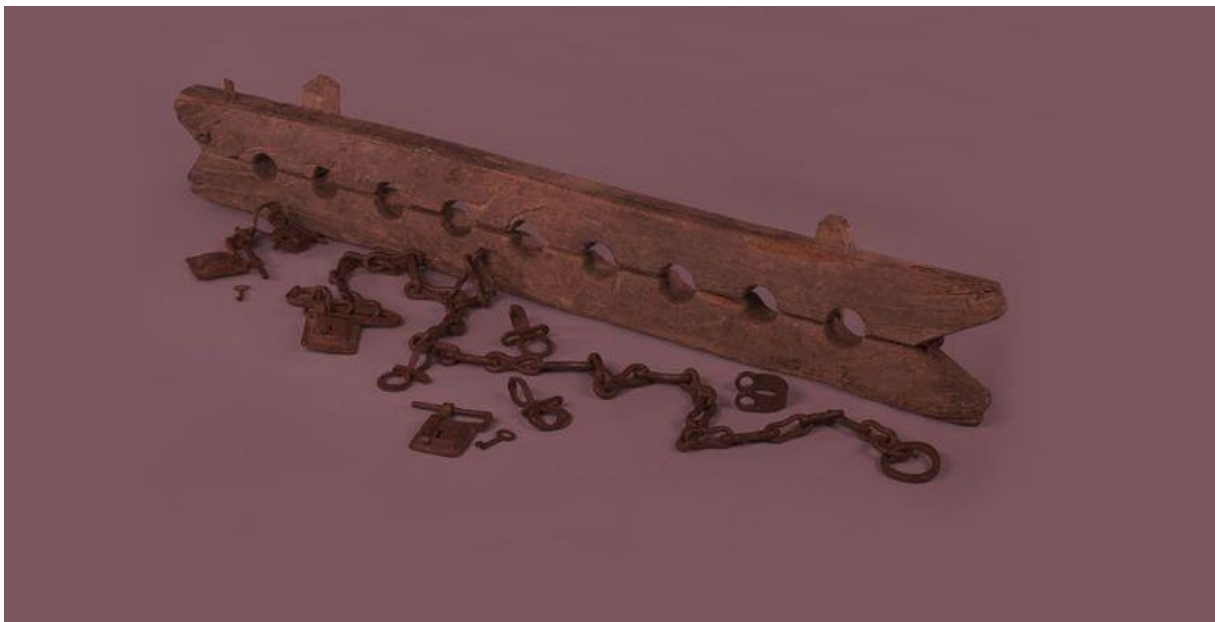
'Tronco' (meervoudige voetboei) die werd gebruikt voor het ketenen van slaven

Tweehonderd miljoen euro zou het kabinet willen uitgeven aan 'bewustwording' over het slavernijverleden. Hoe moet dat eruit gaan zien?