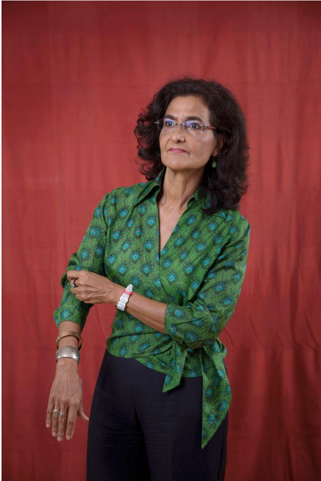
Kathleen Ferrier.

‘Hoe gaan we nu met elkaar om, wie bepaalt hier de norm?’